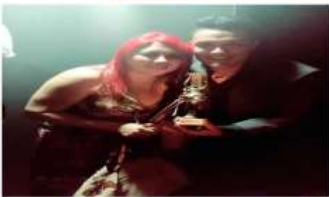
Ganador Reality de Canto