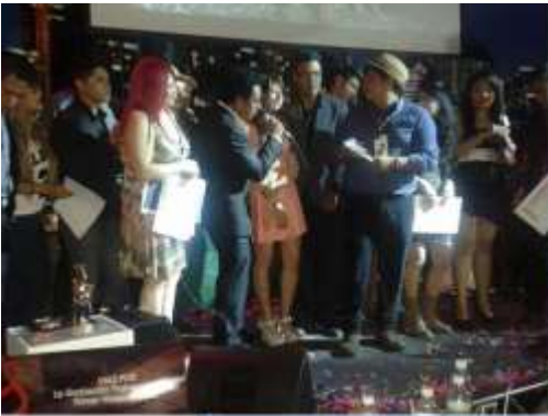
Reality de Canto